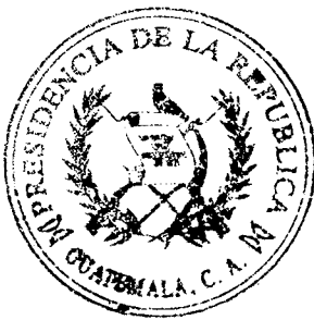
JIMMY MORALES CABRERA