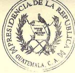
Pedro Brolo Vila Ministro de Relaciones Exteriores